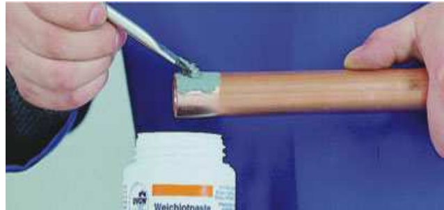
Nanesení tavidla, resp. pájecí pasty

Tavidlem potřete pouze konec trubky. Tak se tavidlo nedostane dovnitř trubky. Aby bylo pájené místo opticky čisté, doporučuje se odstranit po nasunutí trubky a tvarovky přebytečné tavidlo resp. pájecí pastu (které zůstane na trubce. Při tvrdém pájení spoje měď-měď pájkou obsahující fosfor (CP 203 nebo CP 105) není tavidlo nutné.