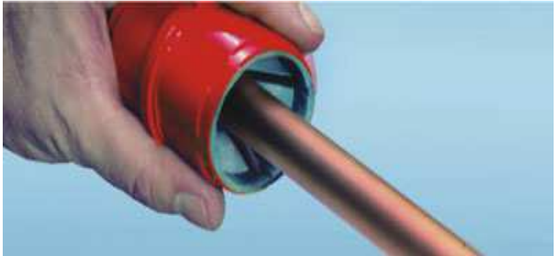
Odstranění otřepu (zde vnější otřep)

Konec trubky uvnitř a vně zbavte otřepu a u měkkých měděných trubek proveďte kalibraci. Je to důležitý předpoklad pro správnou kapilární pájecí spáru. Jestliže se měkké trubky nekalibrují, trubka nemá správný tvar vůči tvarovce. Pokud se pak trubka a tvarovka zasunou do sebe, nemá mezera mezi trubkou a tvarovkou správnou hodnotu kapilární mezery a nedojde ke správnému vyplnění pájeného spoje pájkou.