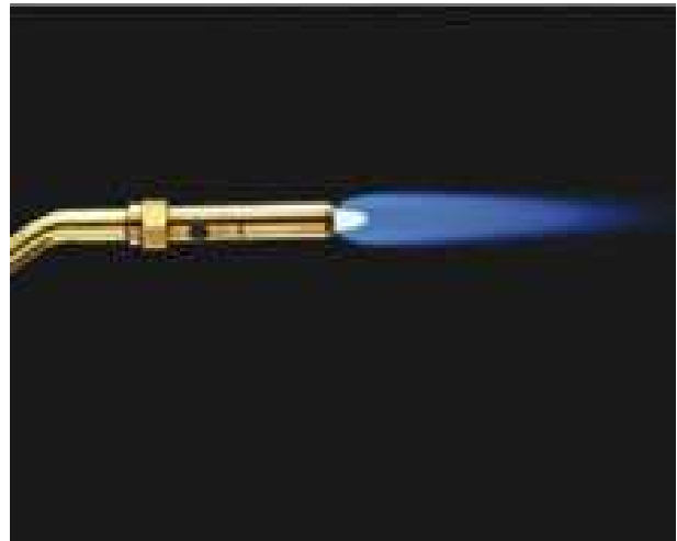
Neutrálně nastavený plamen víceotvorového hořáku

Plamen hořáku se nezapaluje běžnými zapalovači, ale speciálním kamínkovým zapalovačem. U mnohých hořáků je přímo v tělese hořáku zabudovaný piezoelektrický zapalovač.