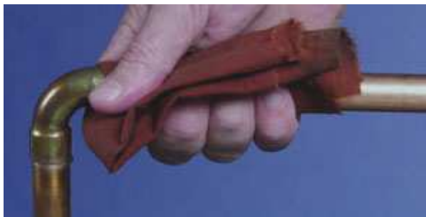
Odstranění zbytků tavidla

V instalacích pitné vody se zbytky tavidla na vnitřní straně trubek odstraňují vypláchnutím celého potrubního systému. Z tohoto důvodu musejí být tavidla pro instalace pitné vody rozpustná ve vodě.