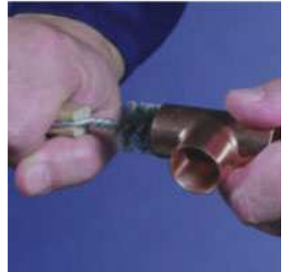
Očištění konce tvarovky